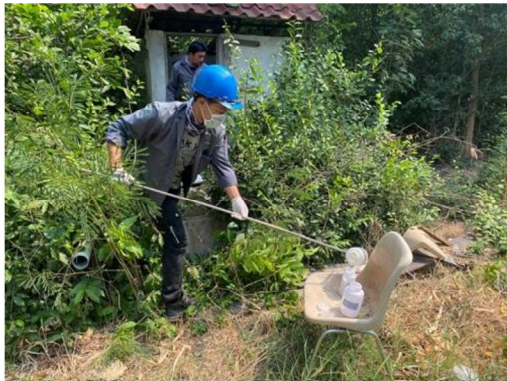
บริเวณโรงเรียนบ้านแก่งซั่วลิตวิทยา