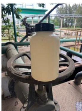
เดือนพฤษภาคม 2567