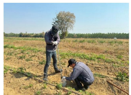
จุดที่ 9 กลุ่มชุดดินที่ 40