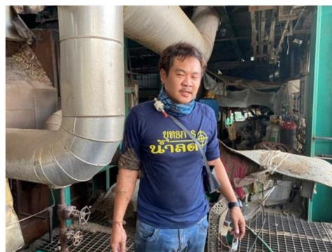
บริเวณหม้อไอน้ำ