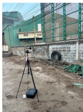
บ้านที่ติดโรงงานมากที่สุดทางทิศเหนือของโรงไฟฟ้า