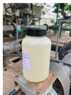
เดือนมิถุนายน 2567