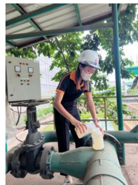
เดือนกุมภาพันธ์ 2567