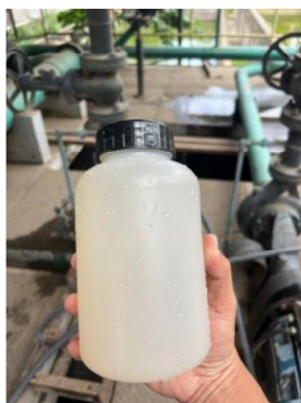
เดือนมีนาคม 2567