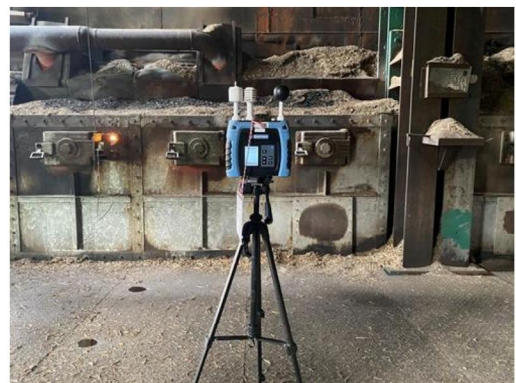
วันที่ 2 พฤษภาคม 2567