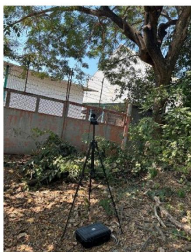
บ้านที่ติดโรงงานมากที่สุดทางทิศใต้ของโรงไฟฟ้า