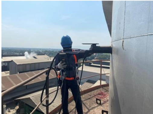
ปล่องหม้อไอน้ำ (Normal Operation)