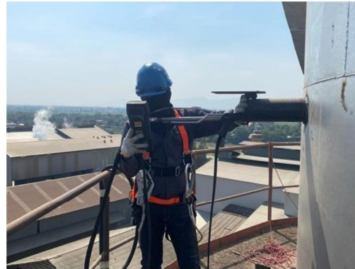
ปล่องหม้อไอน้ำ (Soot blow)