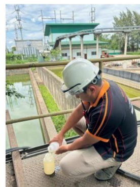
เดือนเมษายน 2567