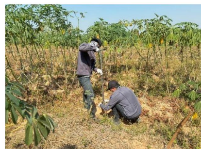
จุดที่ 11 กลุ่มชุดดินที่ 56