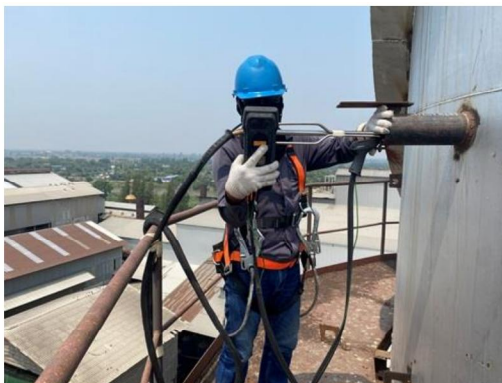
ปล่องหม้อไอน้ำ (Soot blow)