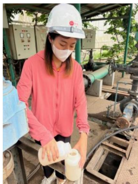
เดือนมกราคม 2567