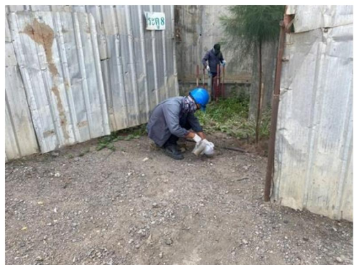
บ่อ Monitoring Well บริเวณลานกองขานอ้อย