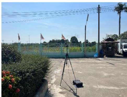
โรงพยาบาลส่งเสริมสุขภาพตำบลบ้านมะเกลือ