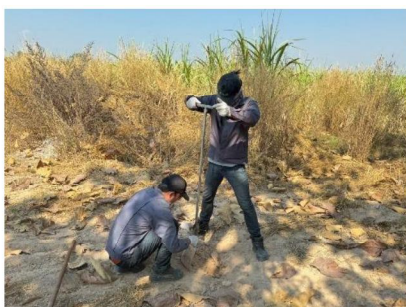
จุดที่ 10 กลุ่มชุดดินที่ 49