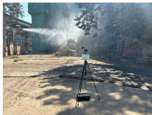
ริมรั้วโรงงานด้านทิศเหนือของโรงไฟฟ้า