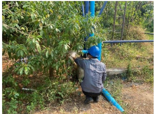
บริเวณบ้านวังยาง