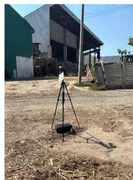
บ้านที่ติดโรงงานมากที่สุดทางทิศเหนือของโรงไฟฟ้า