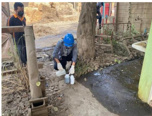
บ่อ Monitoring Well บริเวณระบบบำบัดน้ำเสีย