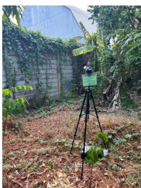
บ้านที่ติดโรงงานมากที่สุดทางทิศใต้ของโรงไฟฟ้า