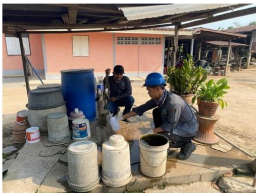
บริเวณบ้านมะเกลือ