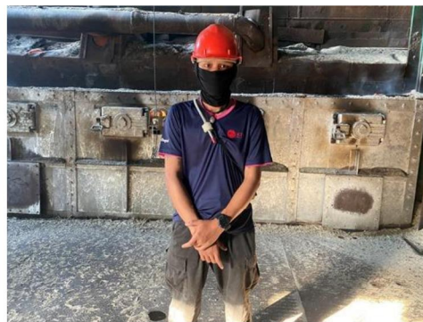
บริเวณระบบสายพานลำเลียงขานอ้อย