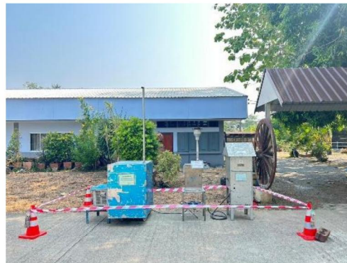
โรงเรียนวัดยางงาม