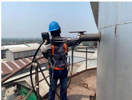
ปล่องหม้อไอน้ำ (Normal Operation)